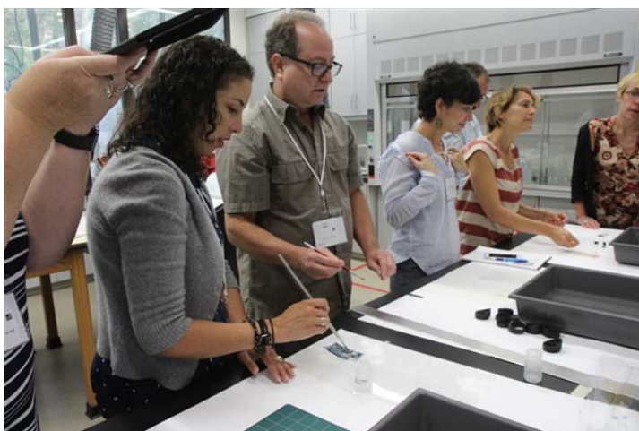
4. פעילות מעבדה

החלק המעשי מעבדה - זיהוי (הדפסות) נייר וטכניקות צילומי צבע, טכניקות בסיסיות של ניקוי פני שטח. (תמונה מס' 3-)