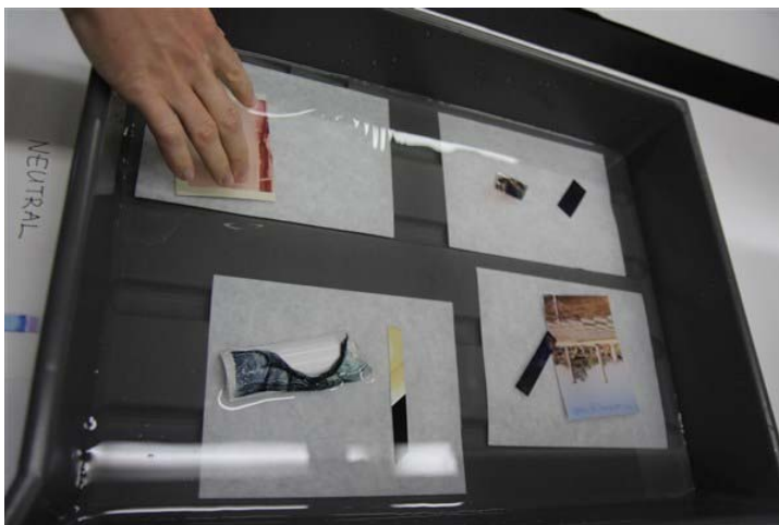
5. פעילות מעבדה

יום ג' – המשך התפתחות טכניקות צילום צבע ופיתוח – תשלילים והדפסות, ביקור באוסף מחלקת הצילום של מוזיאון גטי ובמתקני האחסון הקר – אחסון בתנאי קירור רגילים ואחסון מתחת לנקודת הקיפאון של חמר צילומי רגיש במיוחד. (תמונה מס' 5-6)