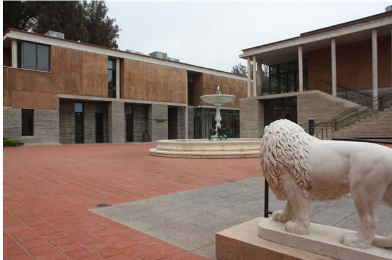
1. ווילה גטי

הקורס התקיים באתר הנקרא "הווילה" של המכון גטי זו ממוקמת באזור מליבו קרוב לכביש החוף האוקיאנוס השקט בלוס אנג'לס (תמונה מס' 1 –ווילה גטי). סדנא זו היא השנייה במספר העוסקת בחמר צילומי במסגרת תכניות השימור השנתית של מכון גטי. בסדנא זו השתתפו 23 אישה ואיש מרחבי העולם רובם ככולם אנשי שימור (תמונה מס' 2 – צילום קבוצתי),