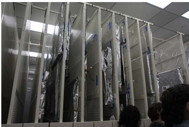
6. אחסנה קרה

יום ג' – המשך התפתחות טכניקות צילום צבע ופיתוח – תשלילים והדפסות, ביקור באוסף מחלקת הצילום של מוזיאון גטי ובמתקני האחסון הקר – אחסון בתנאי קירור רגילים ואחסון מתחת לנקודת הקיפאון של חמר צילומי רגיש במיוחד. (תמונה מס' 5-6)