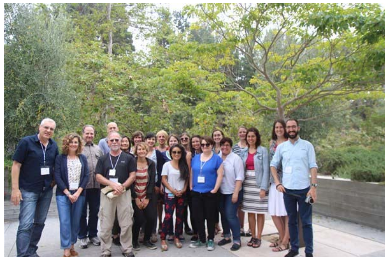
2. משתתפי הסדנא

ממוזיאונים ומארגונים פרטיים העוסקים בצורה פעילה בשימור חמר צילומי. ההרצאות והסדנא המעשית הועברו ע"י Sylvie Pénichon שהיא גם המחברת של הספר Twentieth Century Color Photographs שיצא בהוצאת גטי ראה ISBN 978-1-60606-156-5 ראה תמונה 3.