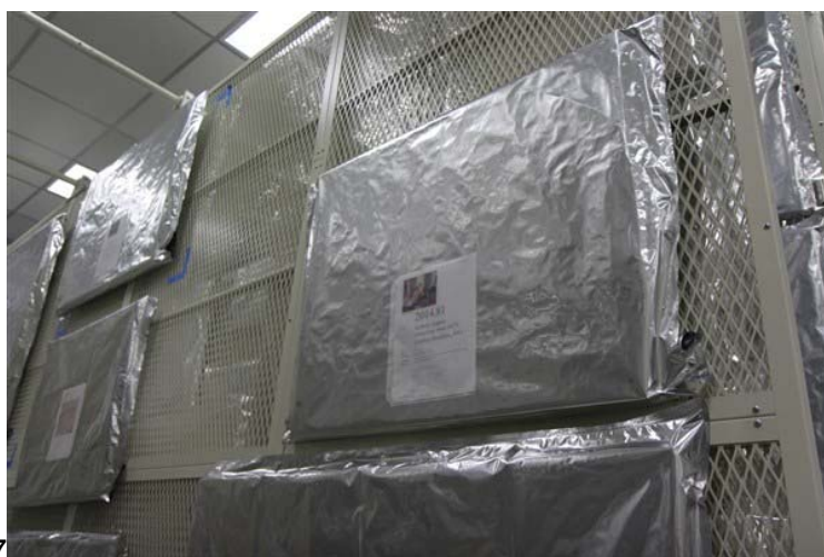
7. אחסנה קרה

יום ד'- המשך התפתחות טכניקות צילום צבע ופיתוח – פיתוח פולרואידי – התפתחות הנייר הפלסטי וכד.