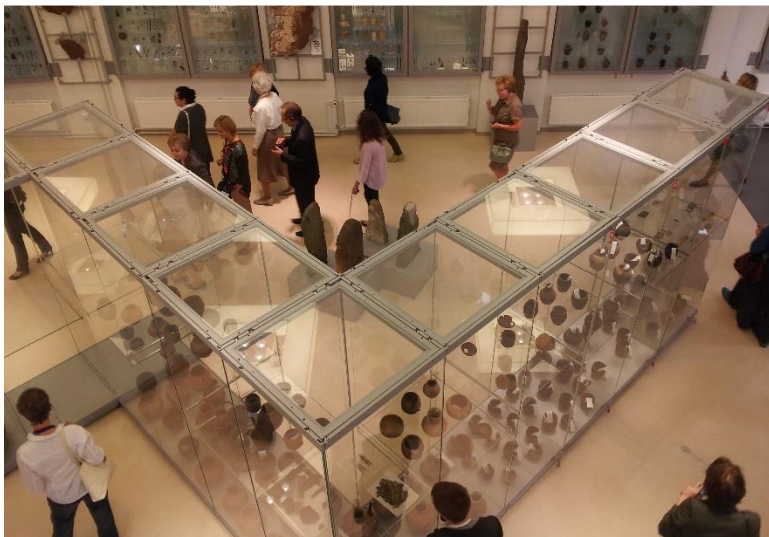
The State Hermitage depository "Staraya Derevnaya"

בערב נערך טקס הפתיחה של קומפלקס האחסון והשימור החדש של ההרמיטאז', שחלק ממנו יהיה פתוח לקהל הרחב. אנו הצטרפנו לסיורים מודרכים בקומפלקס, וכמשתתפי הכנס הורשינו לבקר גם בחלקים ייחודיים, שלא יהיו פתוחים לקהל הרחב (כגון: חלק מן האוספים ומעבדות השימור המתקדמות).