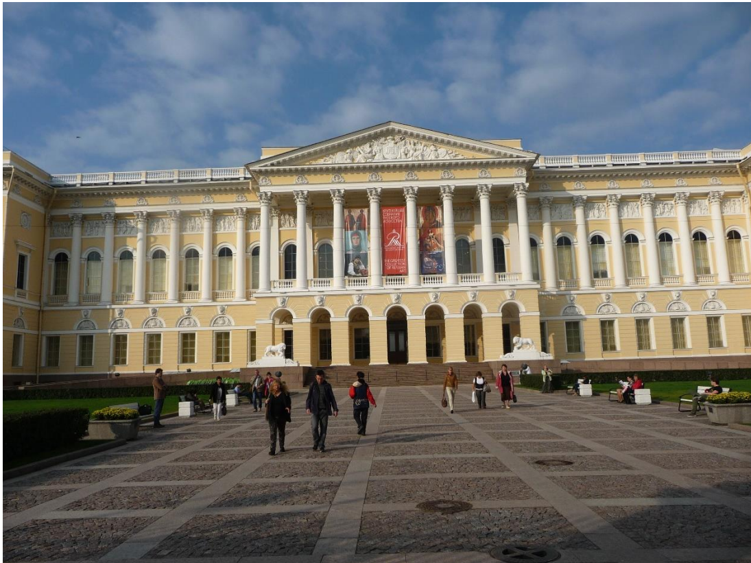
The Russian Museum

היום האחרון לכנס נערך ב "State Museum Reserve "Tsarskoe Selo", שחשף בפנינו צוהר נוסף לעושר ולפאר שהיו מנת חלקה של האימפריה הרוסית בעבר, כמו גם ביקור שערכתי במוזאון הרוסי, שהוקם כבר ב 1895 ע"י הקיסר ניקולאס השני, ובו מבחר אדיר של יצירות אמנות מונומנטאליות מכל התקופות: